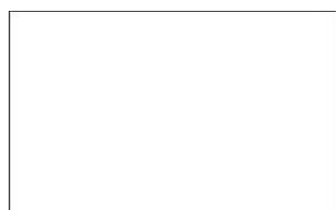
Weiß (RAL 9016)